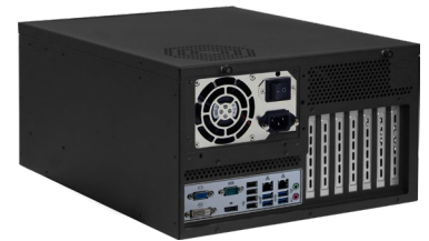
Rückansicht (abb. Ähnlich)