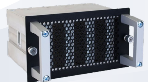
InoNet QuickTray® bis zu 14 GB/s* und 120 TB* mit 4x NVMe-SSDs

* Abhängig vom SSD Typ und Hersteller, real gemessen mit Iometer im continuous write mode