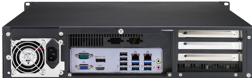
Rückansicht (Ausführung mit 3x full-size Slots)